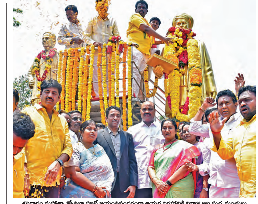
శనివారం మహారాష్ట్ర జ్యోతిబా పూలే జయంతినందర్లంగా ఆయన విగ్రహానికి వివాళి అర్పిస్తున్న మంత్రులు