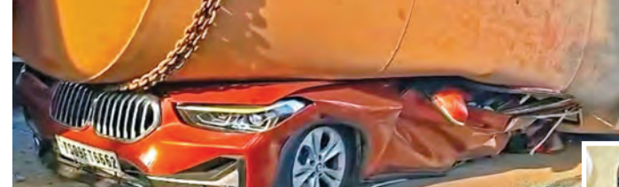
కీసర్ దగ్గర రోడ్డు ప్రమాద దృశ్యం, ఇన్సైట్ మ్యూజు తీసివారం

సీఎం చంద్రబాబు విజయవాడ ఏప్రిల్ 11 ప్రభాతవార్త ప్రతినిధి: కడప జిల్లా ఖాజీపేటలో జాతీక గ్రామంలో హత్య చేసిన ఘటనపై ముఖ్యమంత్రి చంద్రబాబు ఆరా తీశారు. మహిళలు, బాలికలపై దాడులకు తెగబడితే కఠినంగా వ్యవహరించాలని ఆదేశించారు. బాధితులకు న్యాయం చేసే విషయంలో నిందితులని ఎట్టి పరిస్థితుల్లోనూ ఉపేక్షించరాదని స్పష్టం చేశారు. బాధిత కుటుంబానికి న్యాయం జరిగేలా చూడాలని పోలీసులు, ఉన్నతాధికారులను సీఎం ఆదేశించారు.