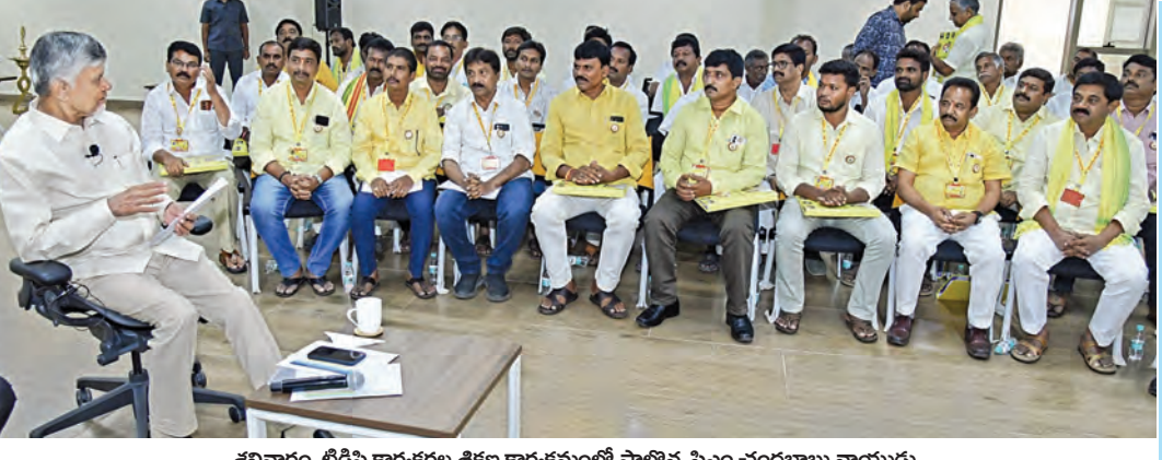
శనివారం టీడీపీ కార్యకర్తల శిక్షణ కార్యక్రమంలో పాల్గొన్న సీఎం చంద్రబాబు నాయుడు

పాల్గొనేతలు, కార్యకర్తలకు సీఎం చంద్రబాబు సలహా పార్టీ బలోపేతానికి 'ఇ-3' కార్యక్రమం ప్రభుత్వం కష్టాలు ప్రజలకు వివరించాలి శిక్షణ కార్యక్రమంలో పాల్గొన్న ముఖ్యమంత్రి