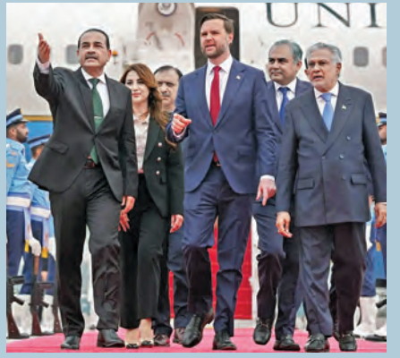
శనివారం ఇస్లామాబాద్ చేరుకున్న షేషివాన్ బృందం ఇస్లామాబాద్, ఏప్రిల్ 11: ఇరాన్ పై యుద్ధం ముగింపు కోసం అమెరికా, ఇరాన్ దేశాల మధ్య జరుగుతున్న శాంతి చర్చల్లో పురోగతి కనిపించకపోయినా ఒకరి డిమాండ్ వార్త మరొకరు పంపకున్నారు. >>2

ఇస్లామాబాద్ లో 'అమెరికా, ఇరాన్ మధ్య తొలిరోజు నాలుగు గంటలు చర్చలు పాక్ ప్రధాని షేహబాజ్ షరీఫ్ మధ్యవర్తిత్వం స్తంభించిన ఆస్తులు, నిధులు విడుదల చేయాలని ఇరాన్ డిమాండ్ కొత్త షరతులతో ముందుకు సాగని చర్చలు హార్డుకోష్టే కొనసాగుతున్న ప్రతిష్టంభన