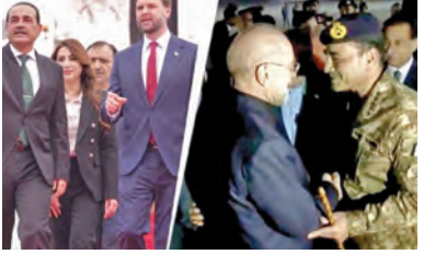
అమెరికా, ఇరాన్ చర్చల సందర్భంగా ఇస్లామాబాద్‌లో భారీ భద్రత హైదరాబాద్, ఏప్రిల్ 11, ప్రణాళికాధార: మధ్య

సంక్షేమ పథకాన్ని కూడా నిలిపివేయడంపై సుప్రీం కోర్టు తీర్పును అనుసరించి, దోపిడీ దుకాణాలను మాత్రమే మూసివేస్తామని అన్నారు. తాము అధికారంలోకి వస్తే, కొత్త ముఖ్యమంత్రి నేతృత్వంలోని తొలి కేబినెట్ సమావేశంలోనే రాష్ట్రంలో అయిప్యాన్ భారత పథకం అమలుకు తీర్మానం చేస్తామని అమలు చేయకుండా త్రవ్వకం ప్రభుత్వం రాష్ట్ర ప్రజలకు అన్యాయం చేసిందని, బీజేపీ ప్రభుత్వంతో ఆ రోజులు ముగిసిపోతాయని తెలిపారు. అంతేగాక కొత్త ప్రభుత్వం చొరబాటుకారులపై కఠిన చర్యలు తీసుకోవడమే కాకుండా, వారికి నశింపే గుర్తింపు పత్రాలు సృష్టించి ఇక్కడ స్థిరపడటానికి హామీ పంపిస్తామని కూడా పదిలపెట్టబోతున్నామని మోడీ హెచ్చరించారు. కాగా, పశ్చిమ బెంగాల్‌లో ఏప్రిల్ 23, 29 తేదీల్లో రెండు దశల అసెంబ్లీ ఎన్నికలు జరగనుండగా, మే 4న ఫలితాలు వెలువడనున్నాయి.