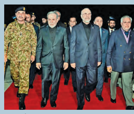
చర్లకోసం పాక్ వచ్చిన ఇరాన్ ప్రతినిధుల బృందం

ఇస్లామాబాద్ లో 'అమెరికా, ఇరాన్ మధ్య తొలిరోజు నాలుగు గంటలు చర్చలు పాక్ ప్రధాని షేహబాజ్ షరీఫ్ మధ్యవర్తిత్వం స్తంభించిన ఆస్తులు, నిధులు విడుదల చేయాలని ఇరాన్ డిమాండ్ కొత్త షరతులతో ముందుకు సాగని చర్చలు హార్డుకోష్టే కొనసాగుతున్న ప్రతిష్టంభన