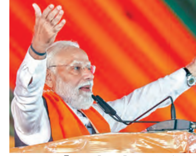
అమలు: ప్రధాని మోడీ

బృందం ఇరాన్‌తో చర్చలకు సిద్ధమవుతున్న సమయంలో ఈ ఆరోపణలు ప్రాధాన్యత సంతరించుకున్నాయి. అమెరికా నిఘా వర్గాల ప్రకారం చైనా నుంచి ఇరాన్‌కు మ్యాస్కోవ్స్ ఆం దుతున్నాయి. భుజంపై నుంచి ప్రయోగం చేసే క్షిప్రణులు తక్కువ ఎత్తులో ప్రయాణించే యుద్ధ విమానాలు, హెలికాప్టర్లను సులభంగా కూల్చివేయగలవు. అంతర్జాతీయంగా విమర్శలు రాకుండా ఉండేందుకు చైనా ఈ ఆయుధాలను నేరుగా కాకుండా మూడో దేశం ద్వారా ఇరాన్‌కు చేరవేస్తున్నట్లు సమాచారం. ప్రస్తుతం అమెరికా ఉన్న కాల్పుల విరమణ సమయాన్ని ఇరాన్ తన ఆయుధ సంపత్తిని తిరిగి సమకూర్చుకోవడానికి ఉపయోగించుకుంటోందని అమెరికా అనుమానిస్తోంది. ఒకవేళ యుద్ధం మళ్లీ మొదలైతే ఈ క్షిప్రణులు అమెరికా విమానాలకు పెను ముప్పుగా మారతాయని ఆందోళన చెందుతోంది. ఈ ఆరోపణలను చైనా ఖండించింది. తాము ఏ దేశానికి ఆయుధాలు సరఫరా చేయడం లేదని వాషింగ్టన్ లోని చైనా రాయబార కార్యాలయం స్పష్టం చేసింది. ఈ పరిణామాలలో ఇస్లామాబాద్ చర్చలపై సీలీనిడల కమ్యూకున్నాయి. చైనా తన వైఖరి మార్చుకోవడాకే, వచ్చే నెలలో జరగాల్సిన ట్రంప్ జినివ్లో షేడీపైనా ప్రభావం పడే అవకాశం ఉందని చైనా అంచనా వేస్తోంది.